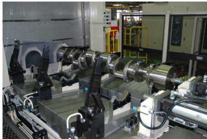
加工物と治具クランパー