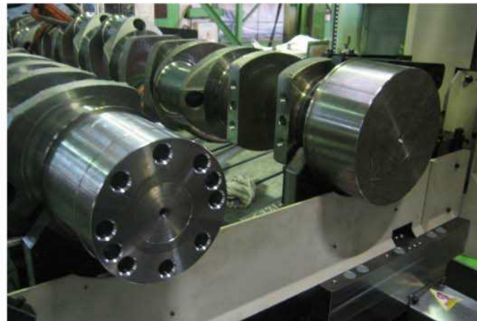
加工部—シャフト端面穴