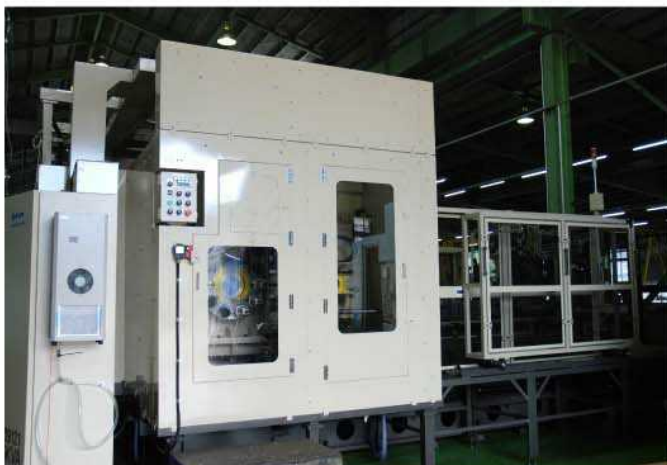
機械後側部—ATCユニット配置