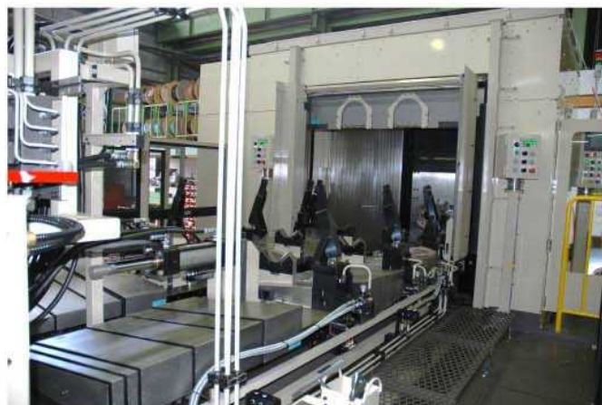
治具テーブル、主軸ヘッド