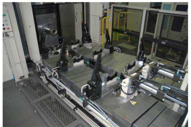
主軸ヘッド、治具テーブル部