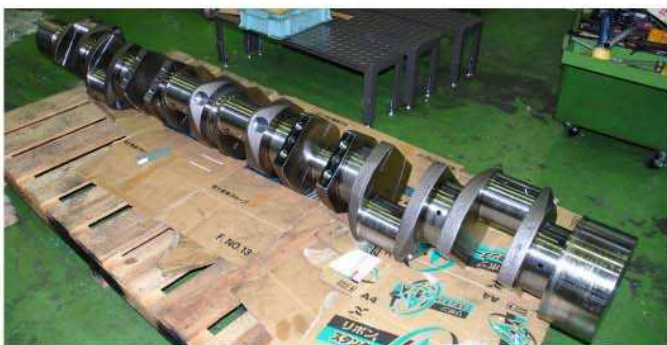
加工物—クランクシャフト