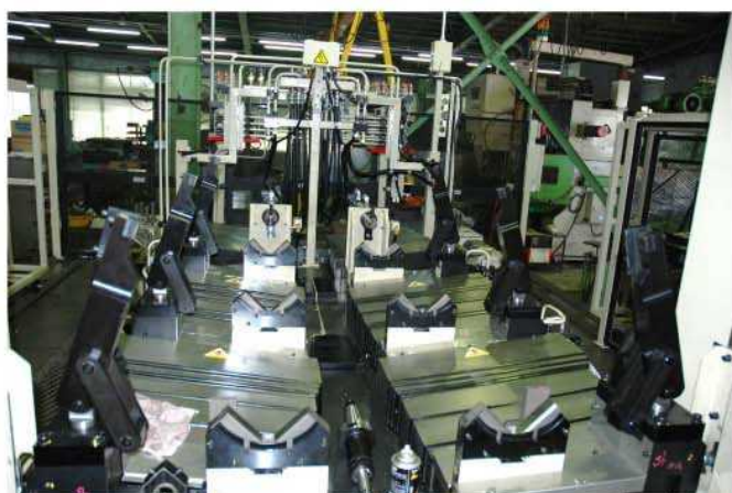
治具テーブルー主軸側より見る