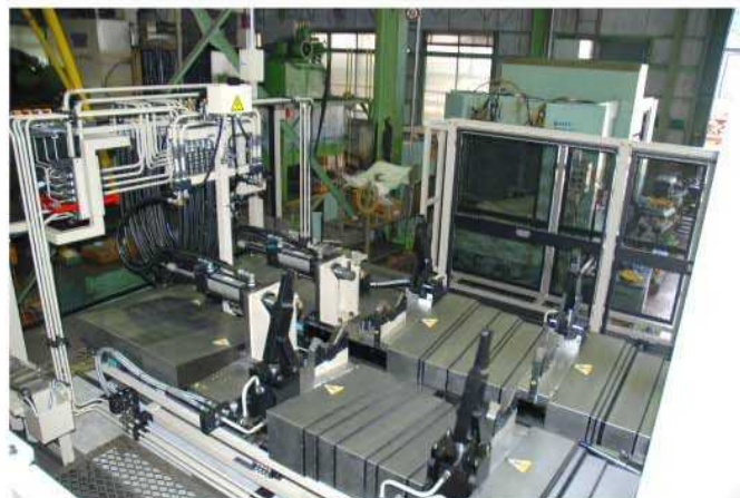
治具テーブルー加工物長手位置決めシリンダー