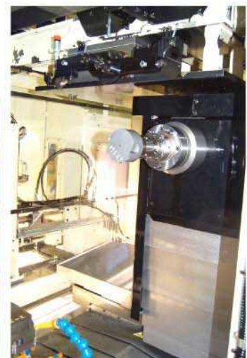
右側マシニングセル ATCユニット