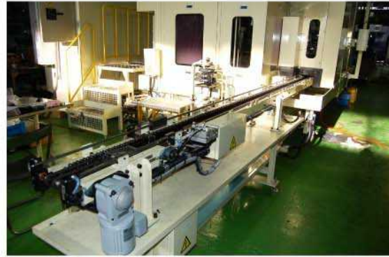
加工物搬出コンベヤー