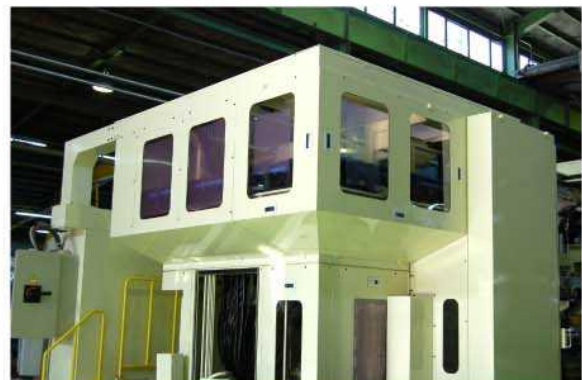
右側マシニングセル、工具マガジン