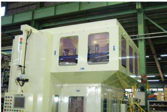
左側マシニングセル、工具マガジン