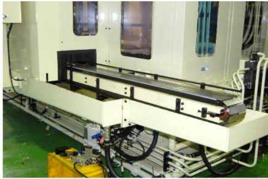
加工物搬入コンベヤー