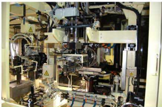
ハンドリング装置クローズアップ