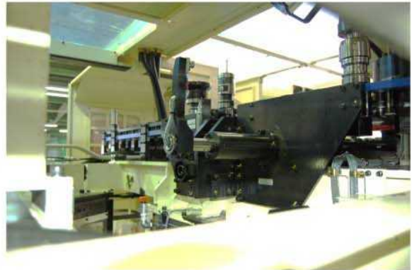
右側マシニングセル、工具破損検知装置