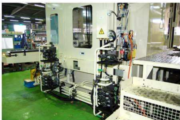
潤滑装置、制御バルブ