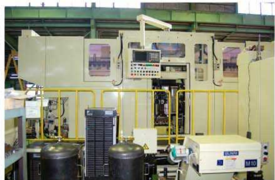
機械後側－マシニングセル側