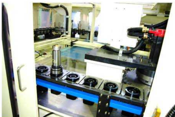
左側工具マガジン80本