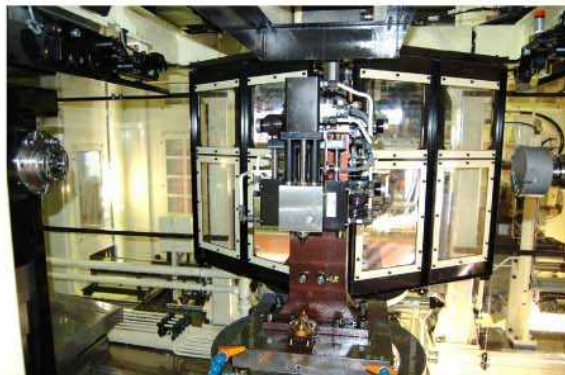
治具部、割出しテーブル部