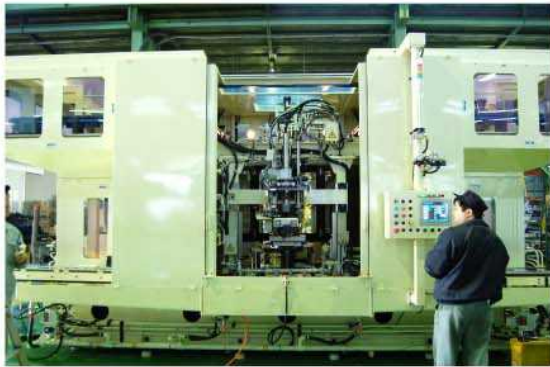
機械正面－搬送装置側