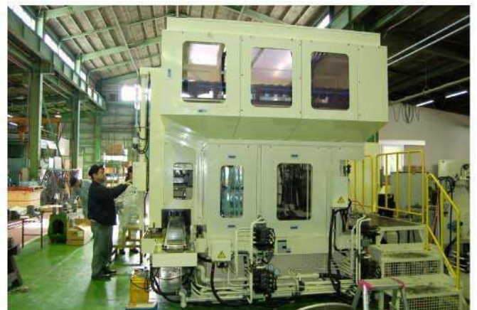
機械右—加工物搬入側