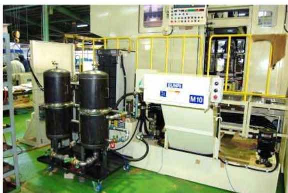
チップコンベヤー、切削油装置