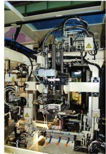
ハンドリング装置全体