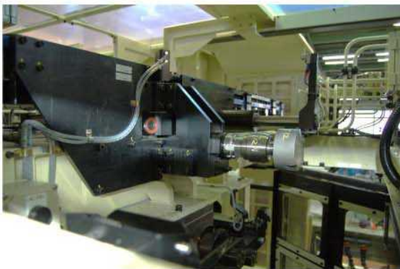
左側マシニングセル、工具破損検知装置