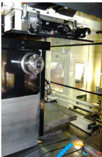
左側マシニングセル ATC ユニット