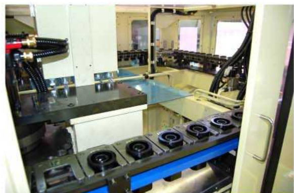
右側工具マガジン80本