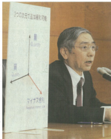
日銀は経済、物価にプラスと説明(黒田東彦総裁)

銀行を取り巻く環境は、%の減益になると試算は過酷だ。マイナス金利導入により、貸し出しが増える一方、各種規制により貸し出しが過度になり、運用リスクは増える。貸し出しが増える一方、各種規制により貸し出しが過度になり、運用リスクは増える。