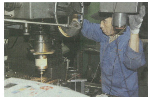
受注動向や業績を見極めながら設備投資を決めるという中小が目立つ(イメージ)

設備投資は「うれしいが、本業次第」と述べる。設備投資は「うれしいが、本業次第」と述べる。設備投資は「うれしいが、本業次第」と述べる。