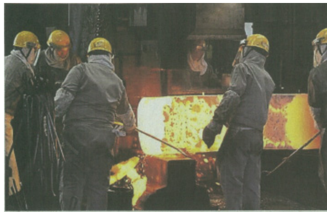
日銀は設備投資に弾みが付くことを期待する