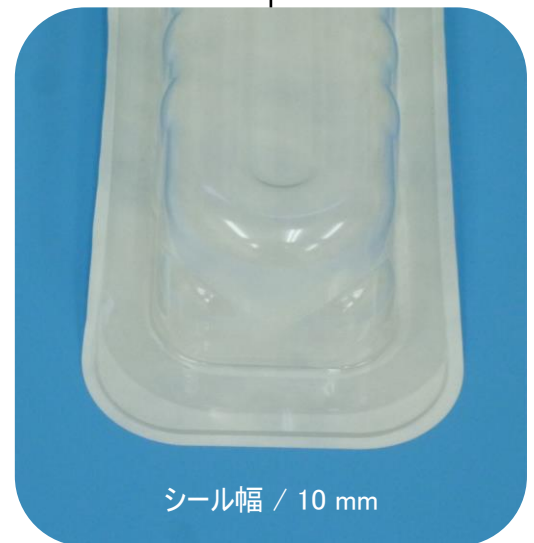
シール幅 / 10 mm