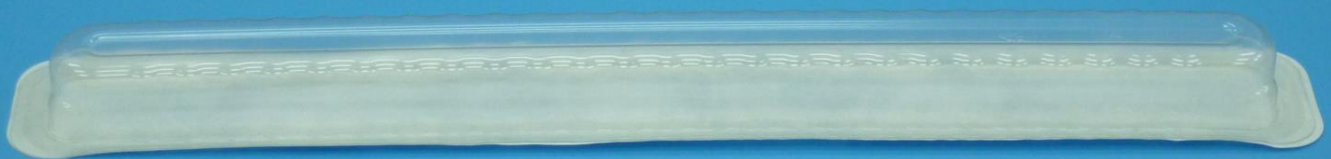
加工品サンプル / W600 × D70 × H37 mm